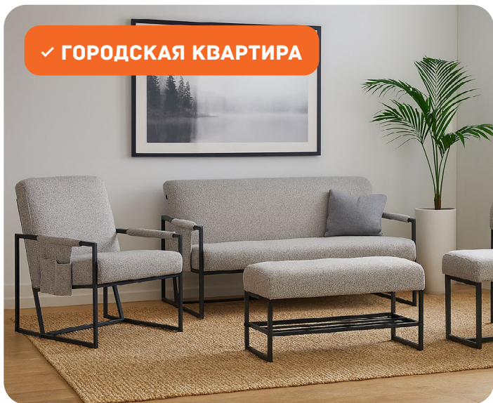
✓ ГОРОДСКАЯ КВАРТИРА