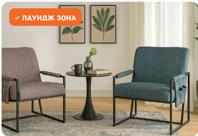
✓ ЛАУНДЖ ЗОНА